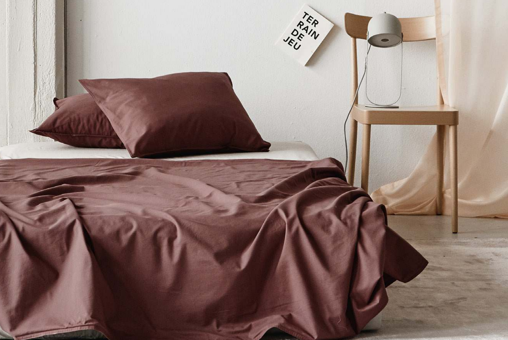
Päslakan Rubra i ekologisk bomull, 600 kr, örngott 200 kr 2-pack, Midnatt.

Överkast, fyllt av giftfritt och ekologiskt linne, 250x195 cm, 1 295 kr, Noy Rd.