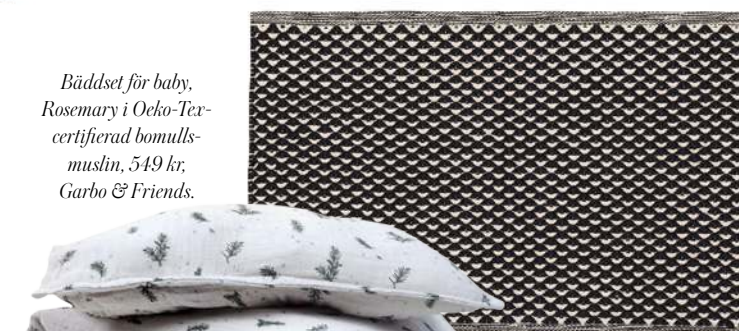
Bäddset för baby, Rosemary i Oeko-Tex-certifierad bomullsmuslin, 549 kr, Garbo & Friends.