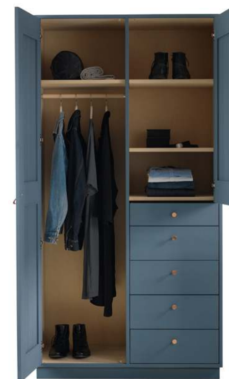
Klädskåp 11 av björk, målat med miljövänlig äggoljetempera, 31023 kr, Norrgavel.