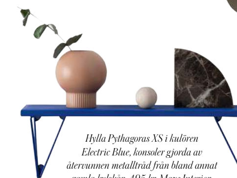
Hylla Pythagoras XS i kulören Electric Blue, konsoler gjorda av återvunnen metalltråd från bland annat gamla kylskåp, 495 kr, Maze Interior.