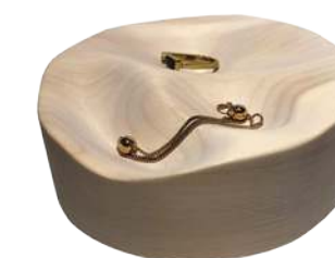
Smyckesförvaring av svensk lind som oljats med vitpigmenterad hårdvaxolja, 500 kr, @emsoder.