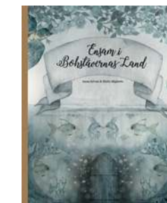
Bok Ensam i bokstävernas land tryckt på FSC-certifierat tryckeri, 230 kr, Mrs Mighetto.