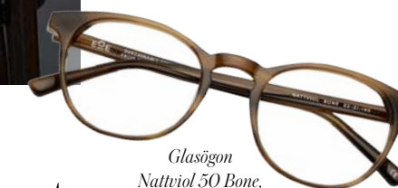
Glasögon Natviol 50 Bone, fria från ftalater och helt återvinningsbara, 2300 kr, EOE Eyewear.